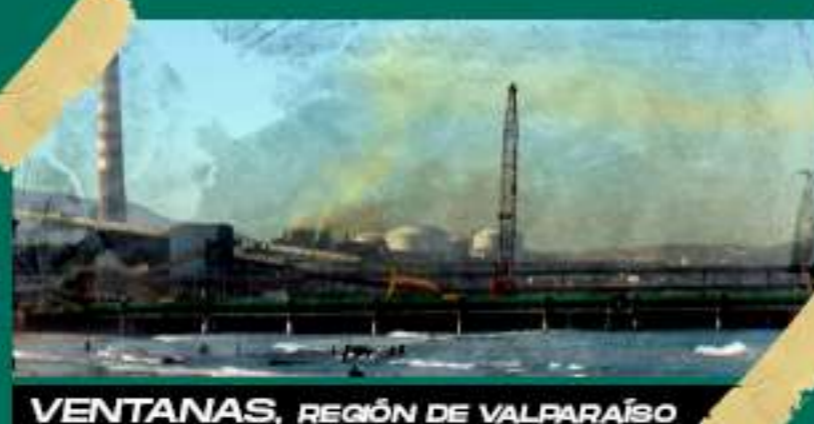
VENTANAS, REGIÓN DE VALPARAÍSO