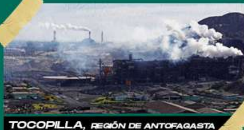
TOCOPILLA, REGIÓN DE ANTOFAGASTA