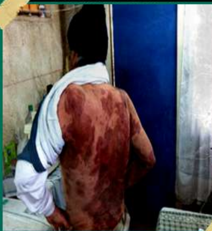
EFFECTOS DE LA CONTAMINACIÓN SUFRIDA EN LA PLANTA DE FUNDICIÓN DE CODELCO, QUINTERO.