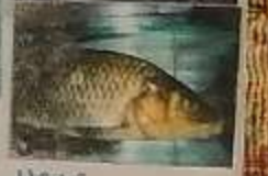
LISCAS PEJERREY CARPAS