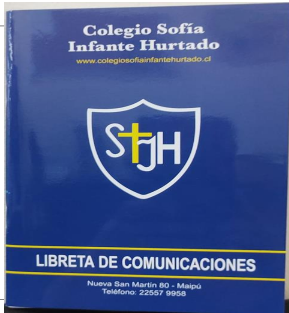
Libreta de Comunicaciones