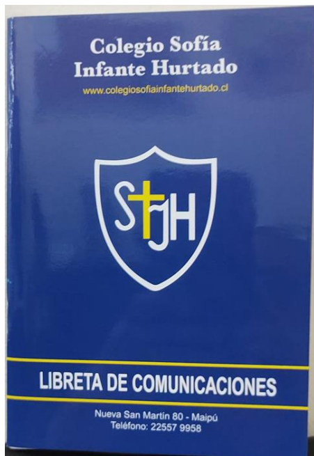
Libreta de Comunicaciones